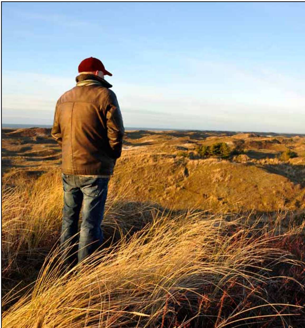
'Moet mijn geld naar die neven en nichten die ik nooit zie?'

'Aan een bestuurslid van het Texelfonds heb ik vervolgens gevraagd waar ze nou precies voor stonden. Dat is me nu duidelijk. Kort gezegd willen ze de kwaliteit van de Texelse samenleving verbeteren. Dat spreekt me aan. Het maakt me niet uit waar het Texelfonds mijn bezit aan wil besteden. Ik heb vertrouwen in het bestuur en ga er van uit dat het helemaal goed komt.'