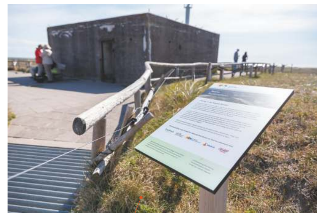
Luisterplekken/verhalen uit WOII (Toekenning 2019)