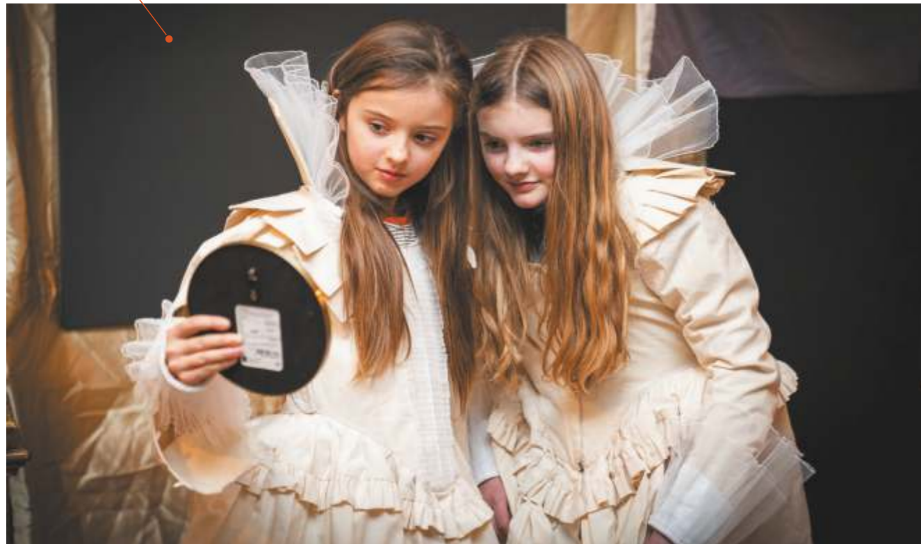
Cultuurnacht Texel - Oosterend