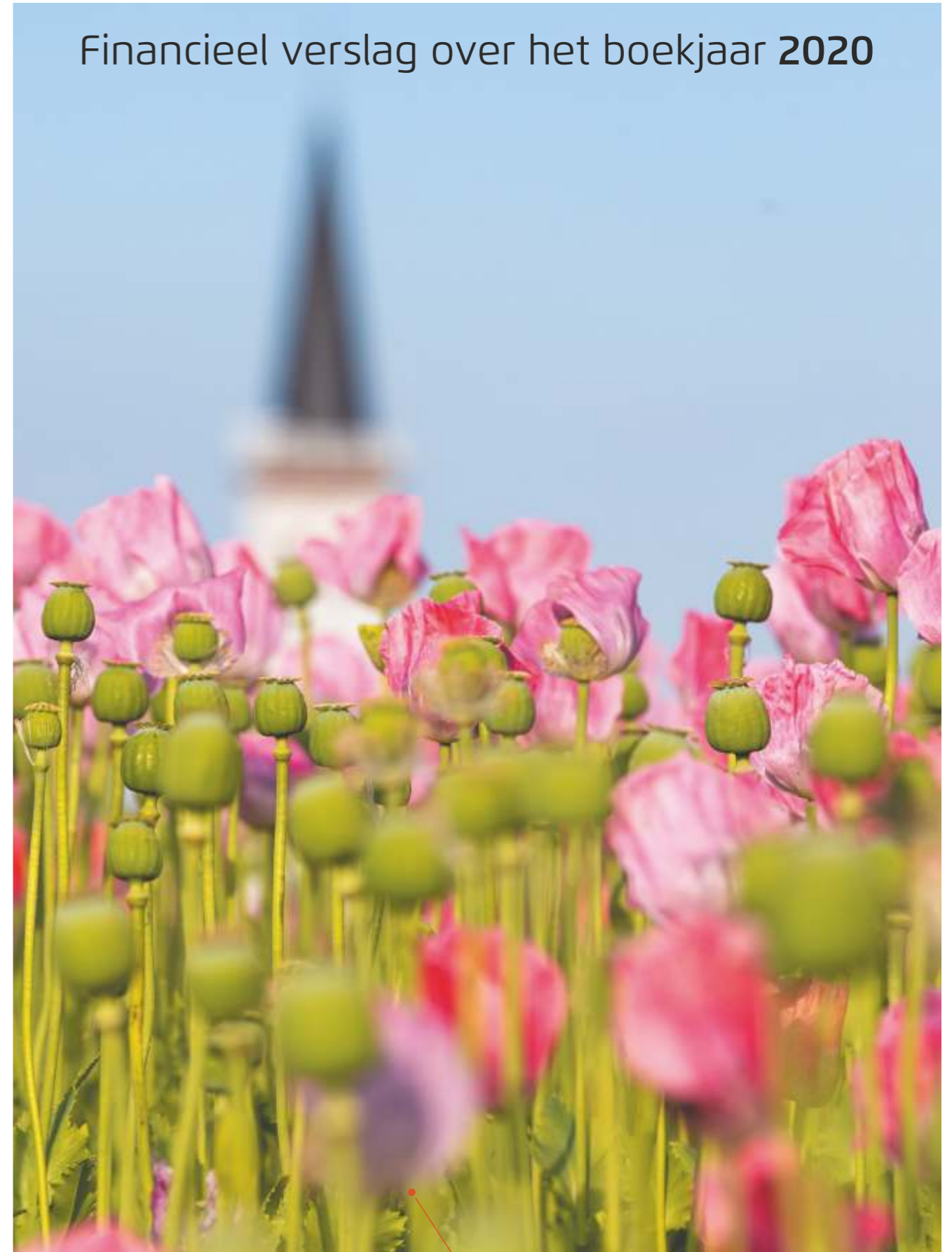
Papaverveld bij Den Hoorn