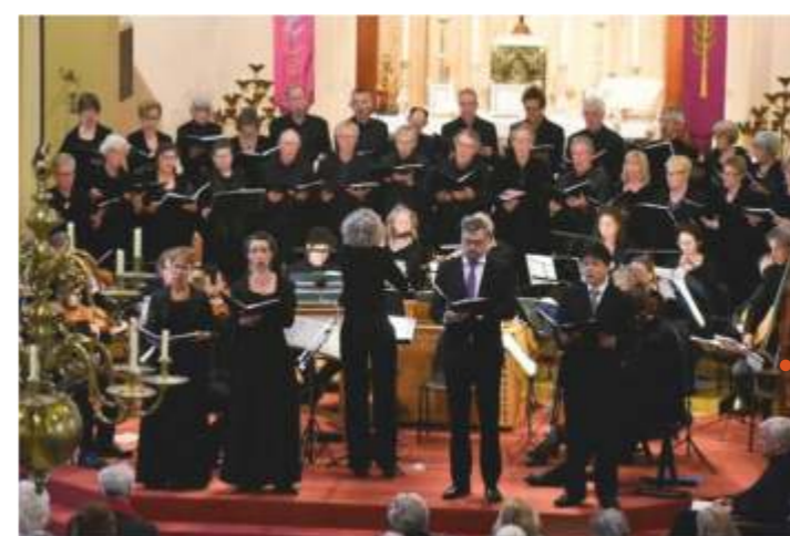
Uitvoering Johannes Passion van J.S. Bach door het Texelse koor Amici Cantus