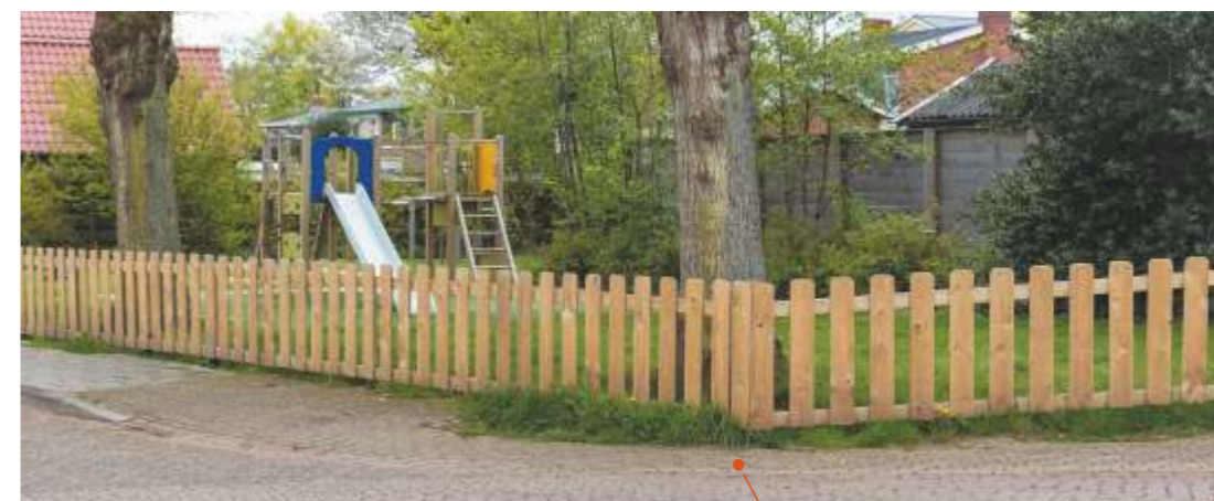
Verrij je Buurt - Afscherming bij de speeltuin hoek Boogerd/Willem van Beierenstraat.