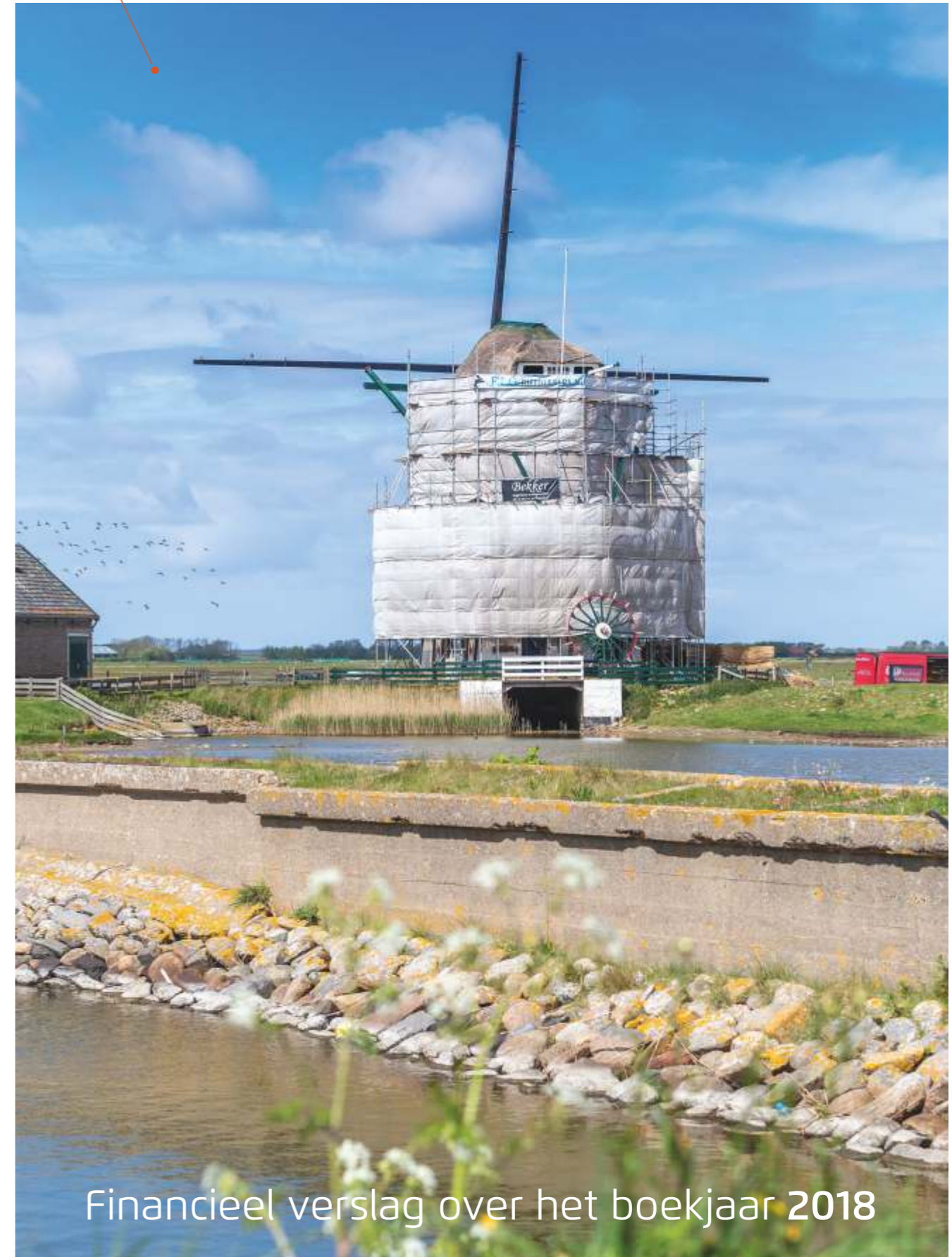
Restauratie molen Het Noorden

Financieel verslag over het boekjaar 2018