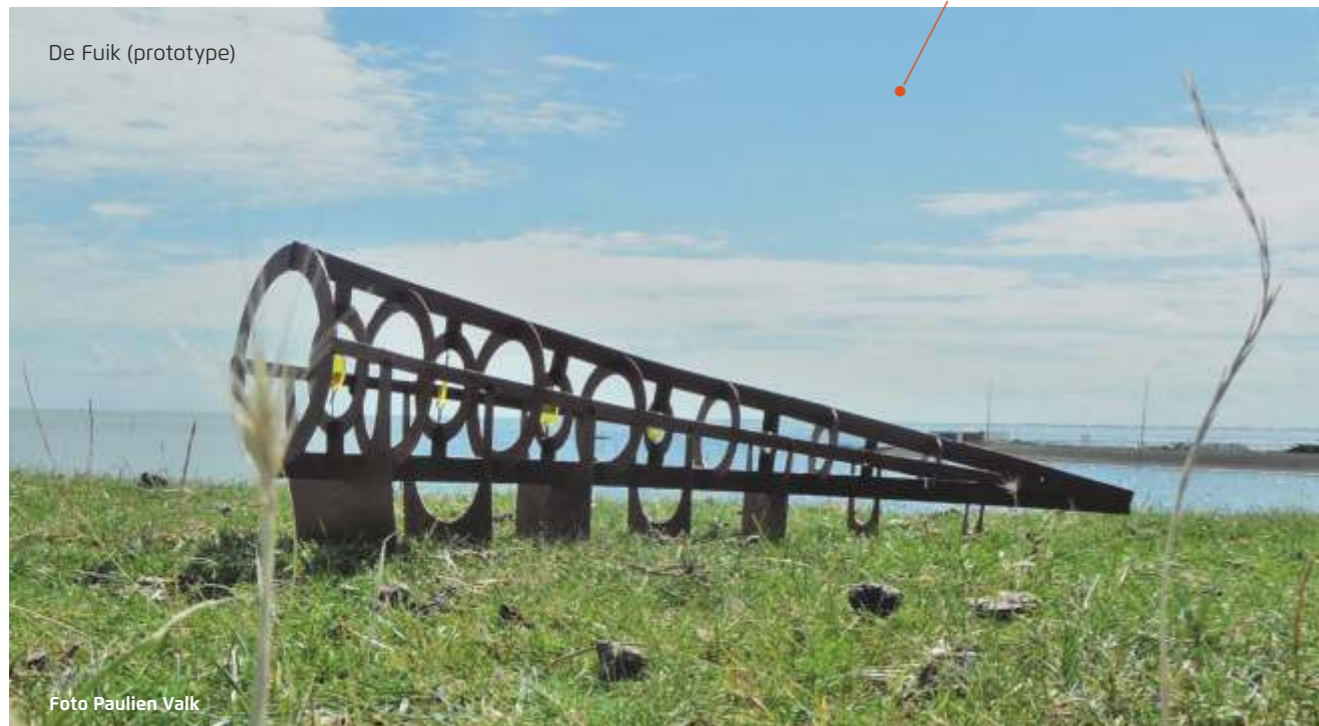
De Fuik (prototype)

Er zijn in 2018 geen aanvragen toegekend uit het Joustra en De Beurs zorgfonds.