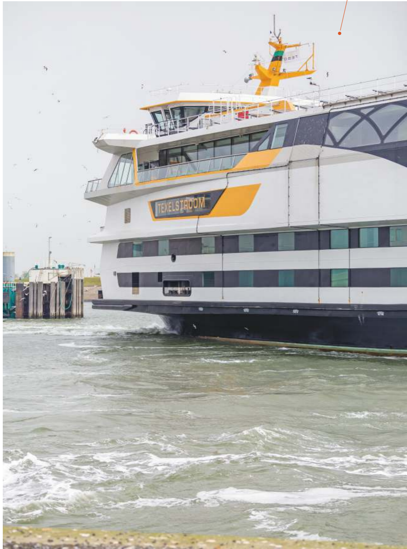
Veerboot De Texelstroom