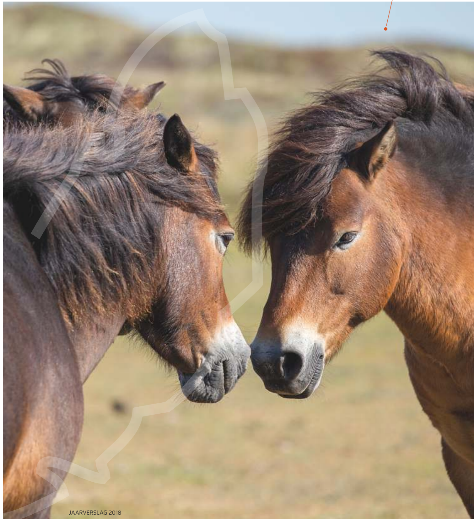
Exmoorpony's in de Bollenkamer

Bestuur Texelfonds Wessels Ontwerpt Texelfonds Gertha Wessels Stockfoto's