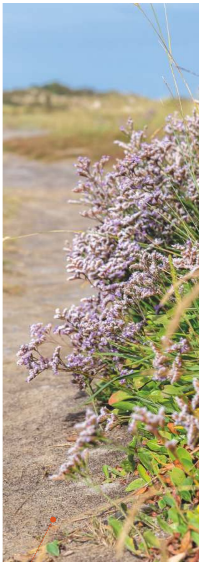
Lamsoor in De Slufter

Voor de lange termijn wil het Texelfonds blijven functioneren en voortdurend een bijdrage leveren aan de kwaliteit van de Texelse samenleving. Het beleid van het bestuur is erop gericht om het Texelfonds steeds meer 'in te bedden' in de Texelse samenleving. Het bestuur constateert met voldoening dat er in de afgelopen jaren al een grote mate van vertrouwen is opgebouwd. Toch zal hier bij voortdurende aandacht aan worden besteed. Hierdoor zal het fonds in staat zijn om steeds meer geïnteresseerden voor het Texelfonds te bereiken.