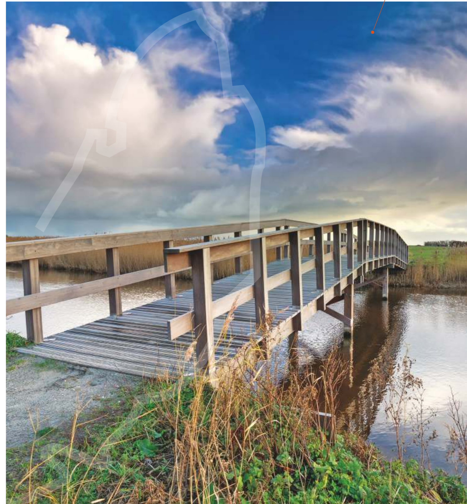
Brug over de Roggesloot - Natuurgebied Dorpszicht