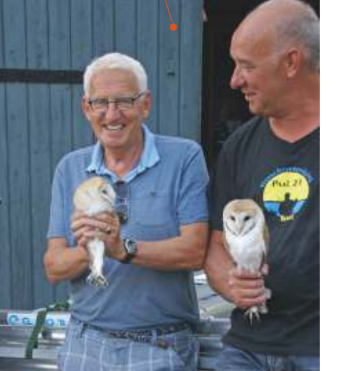
Steiger voor werkgroep Kerkuil