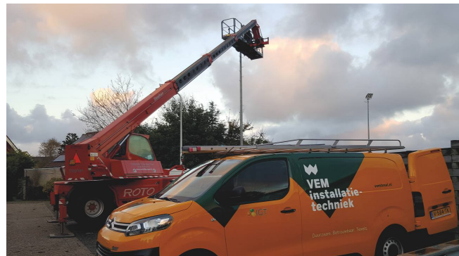
Verlichting tennisbanen Oosterend