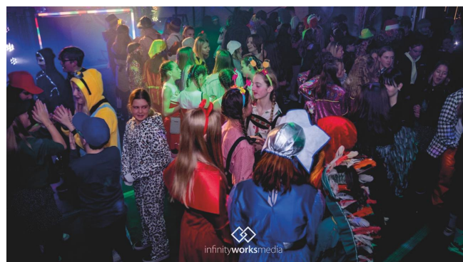
Frisfeest Ouwe Sunderklaas