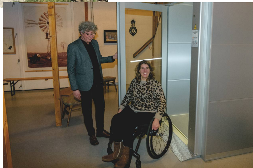
Lift Museum Waelstee