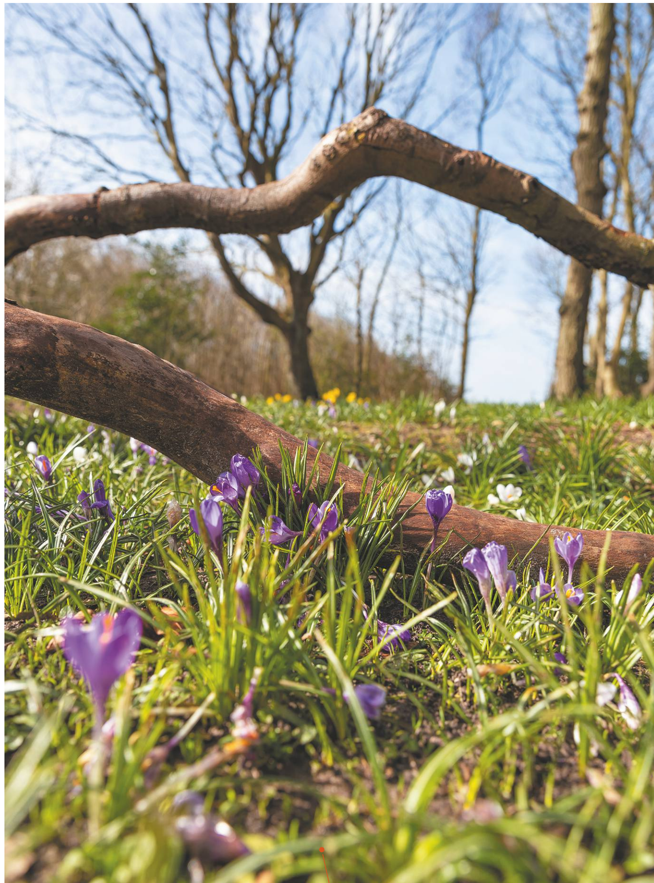
Het Doolhof - De Hoge Berg