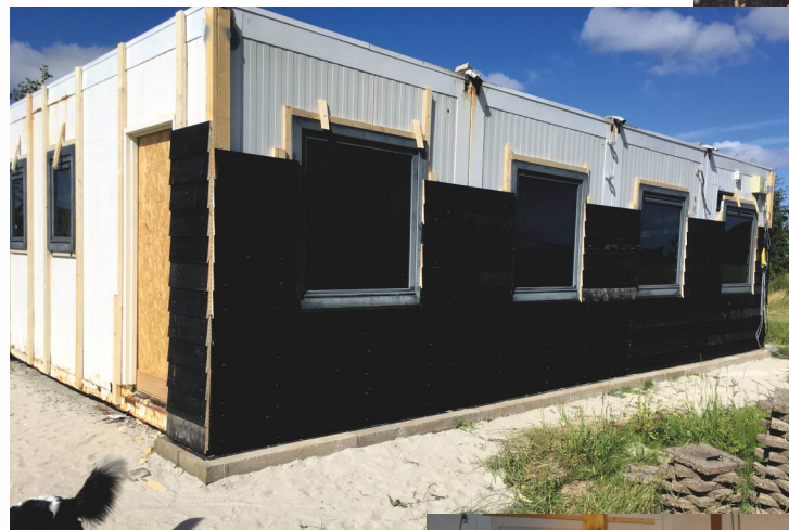
Plaatsen kantine-bergruimte IJsbahn Oosterend