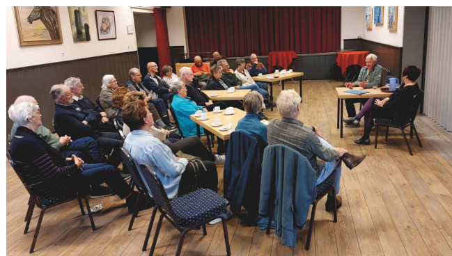
Theater Na de Dam