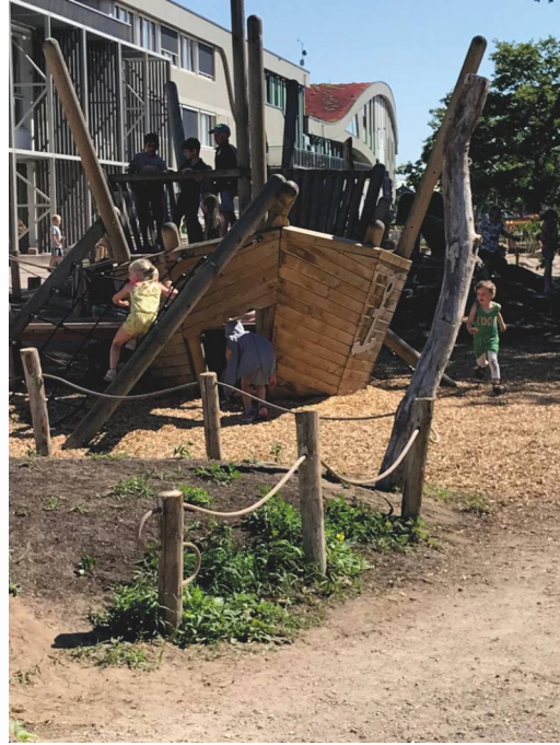
Aanleggen uitdagend natuurspeelrein