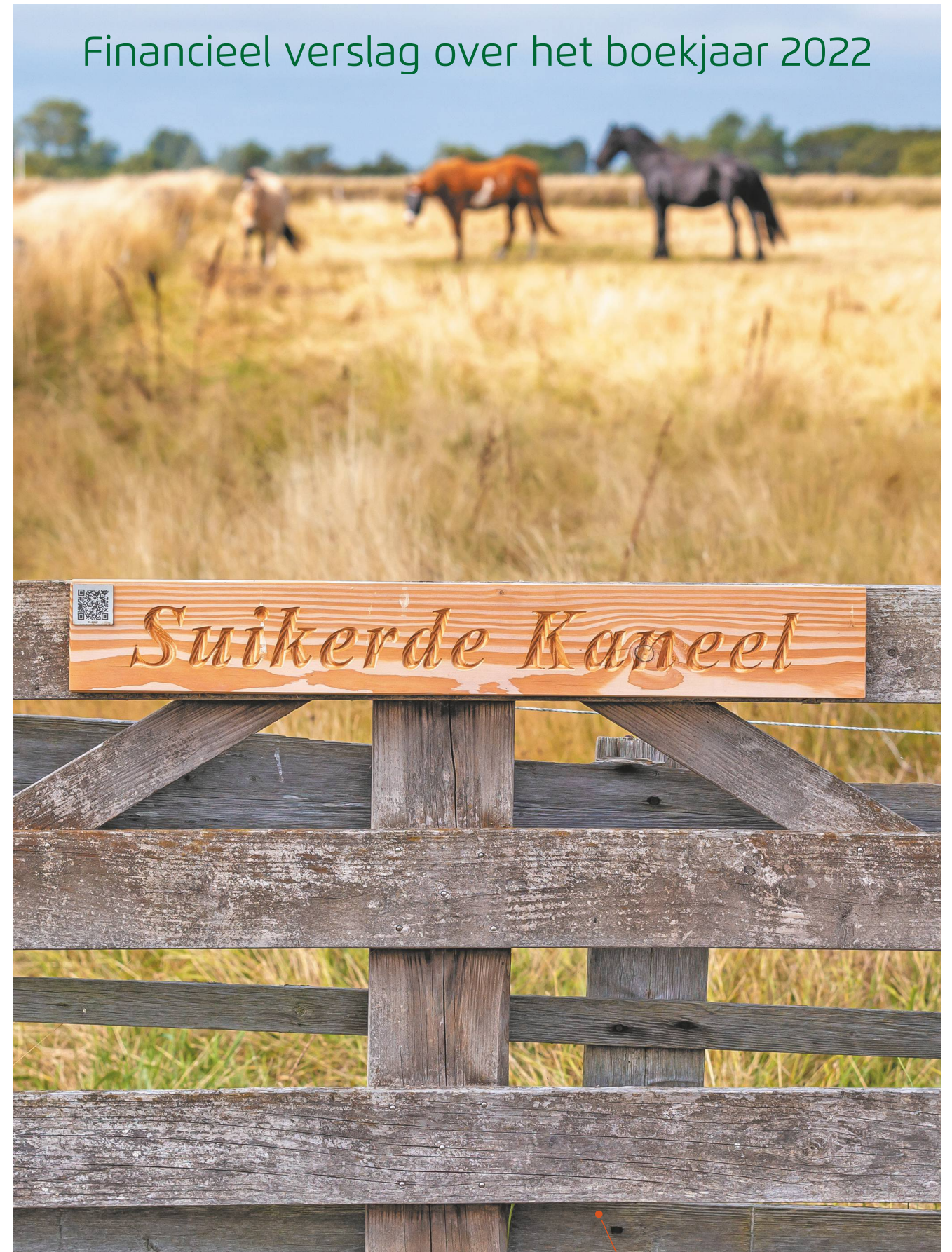
Veldnamen Hoge Berg