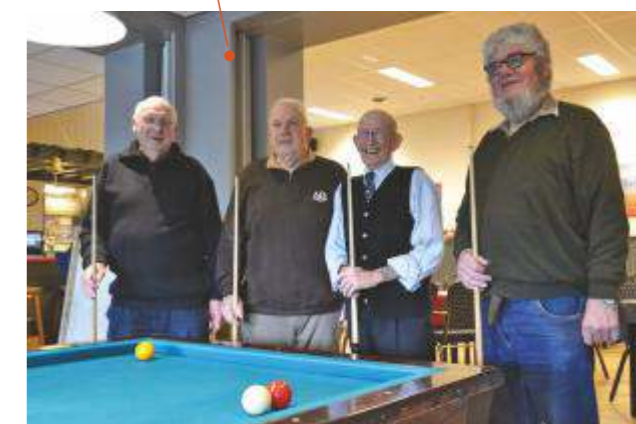
Dorpshuis 't Skiltje, nieuw biljartlaken

Reden van afwijzing van een project is dat niet het algemeen belang wordt gediend, dat de aanvraag met de exploitatie te maken heeft of dat het budget van het fonds niet toereikend is voor de gevraagde donatie.