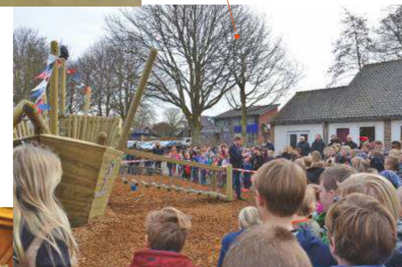
Nieuw speelschip Jac. P. Thijsseschool