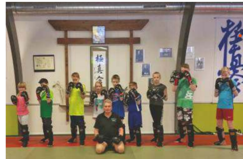
Sociaal maatschappelijk sportproject