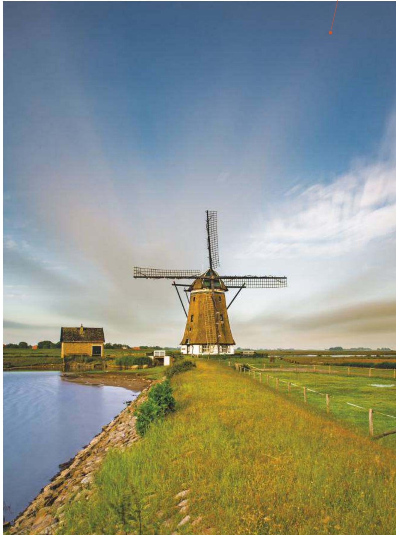
Molen Het Noorden