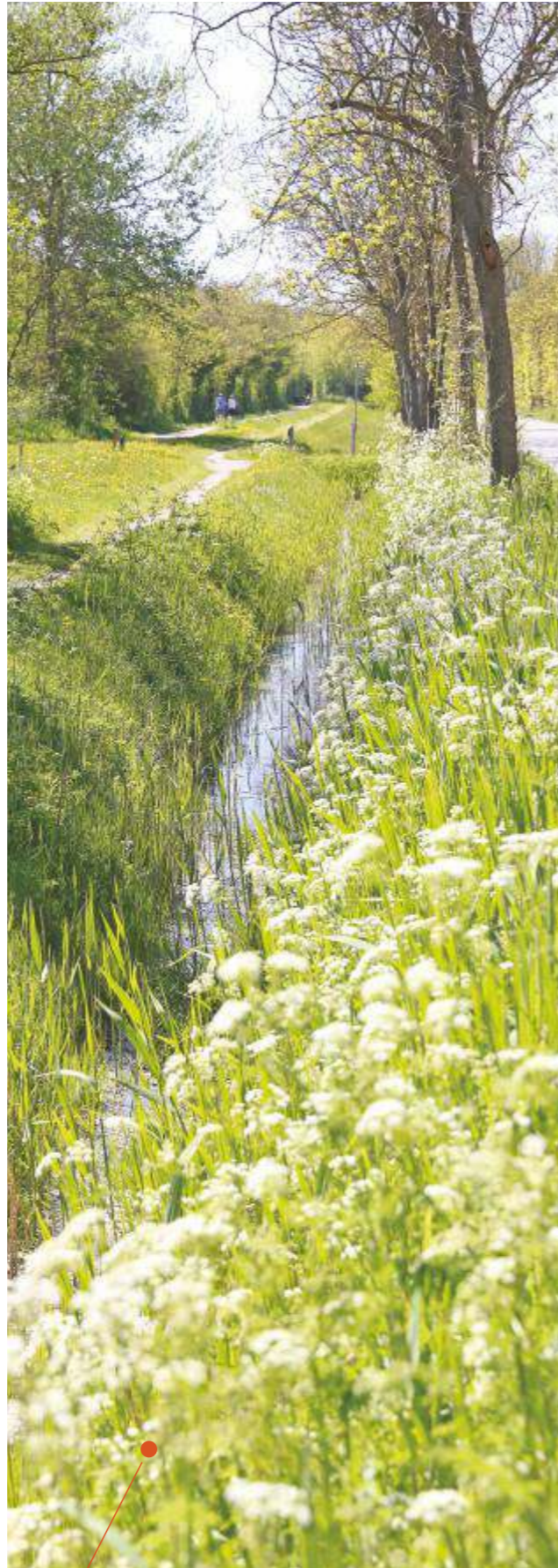
Krimweg, De Cocksdorp

Voor de lange termijn wil het Texelfonds blijven functioneren en voortdurend een bijdrage leveren aan de kwaliteit van de Texelse samenleving. Het beleid van het bestuur is erop gericht om het Texelfonds steeds meer 'in te bedden' in de Texelse samenleving. Het bestuur constateert met voldoening dat er in de afgelopen jaren al een grote mate van vertrouwen is opgebouwd. Toch zal hier bij voortdurende aandacht aan worden besteed. Hierdoor zal het fonds in staat zijn om steeds meer geïnteresseerden voor het Texelfonds te bereiken.