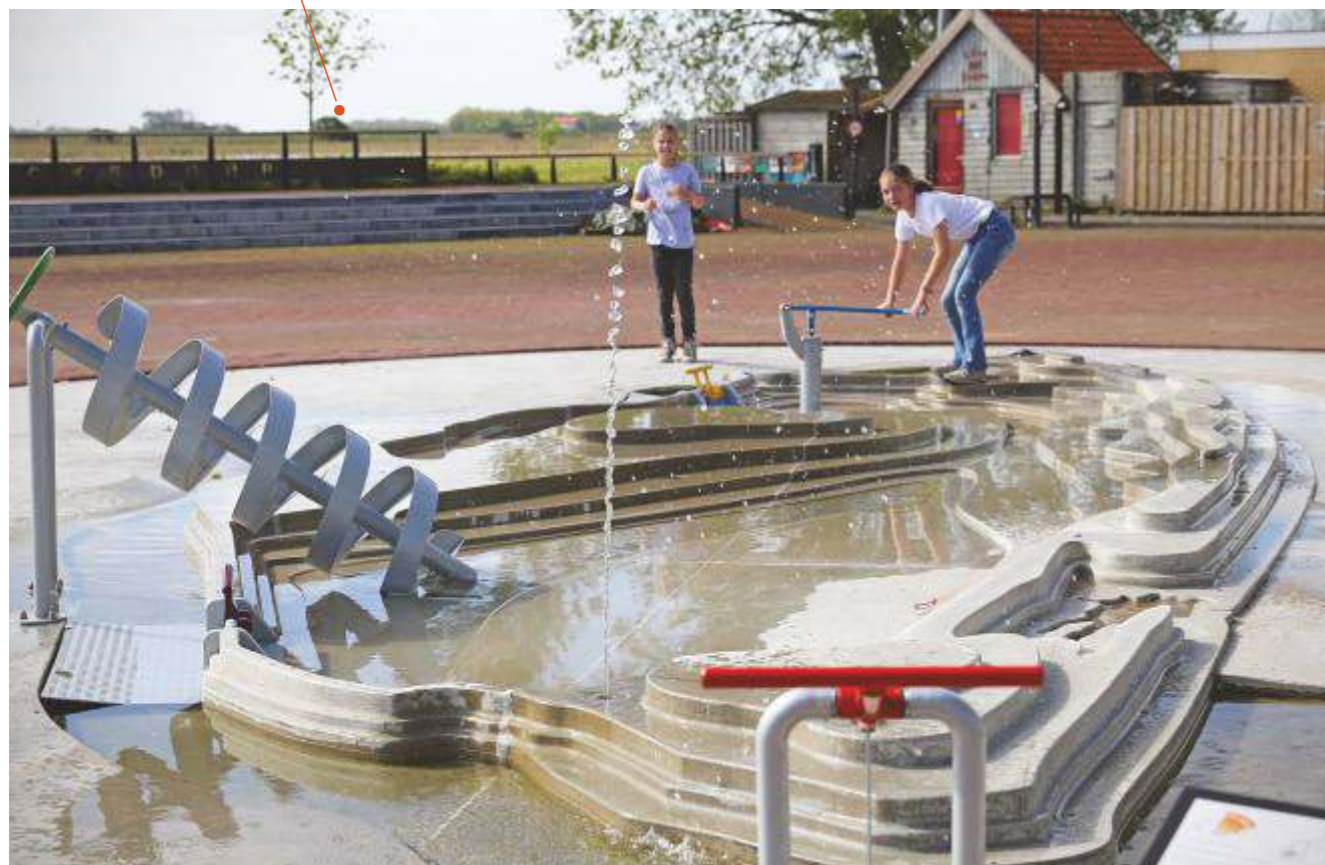
Waterspeelplaats, De Cocksdorp (schenking 2016)