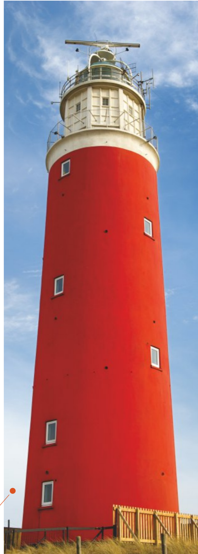
Vuurtoren, De Cocksdorp

Voor de lange termijn wil het Texelfonds blijven functioneren en voortdurend een bijdrage leveren aan de kwaliteit van de Texelse samenleving. Het beleid van het bestuur is erop gericht om het Texelfonds steeds meer 'in te bedden' in de Texelse samenleving. Het bestuur constateert met voldoening dat er in de afgelopen jaren al een grote mate van vertrouwen is opgebouwd. Toch zal hier bij voortduring aandacht aan moeten worden besteed. Hierdoor zal het fonds in staat zijn om steeds meer geïnteresseerden voor het Texelfonds te bereiken.