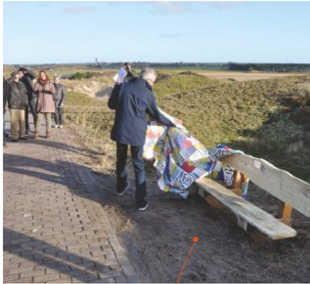
Schenking twee banken langs het pad 'Het verlegde Slag langs Loodsmansduin'.