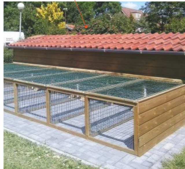
Realisatie konijnenhokken Kotex