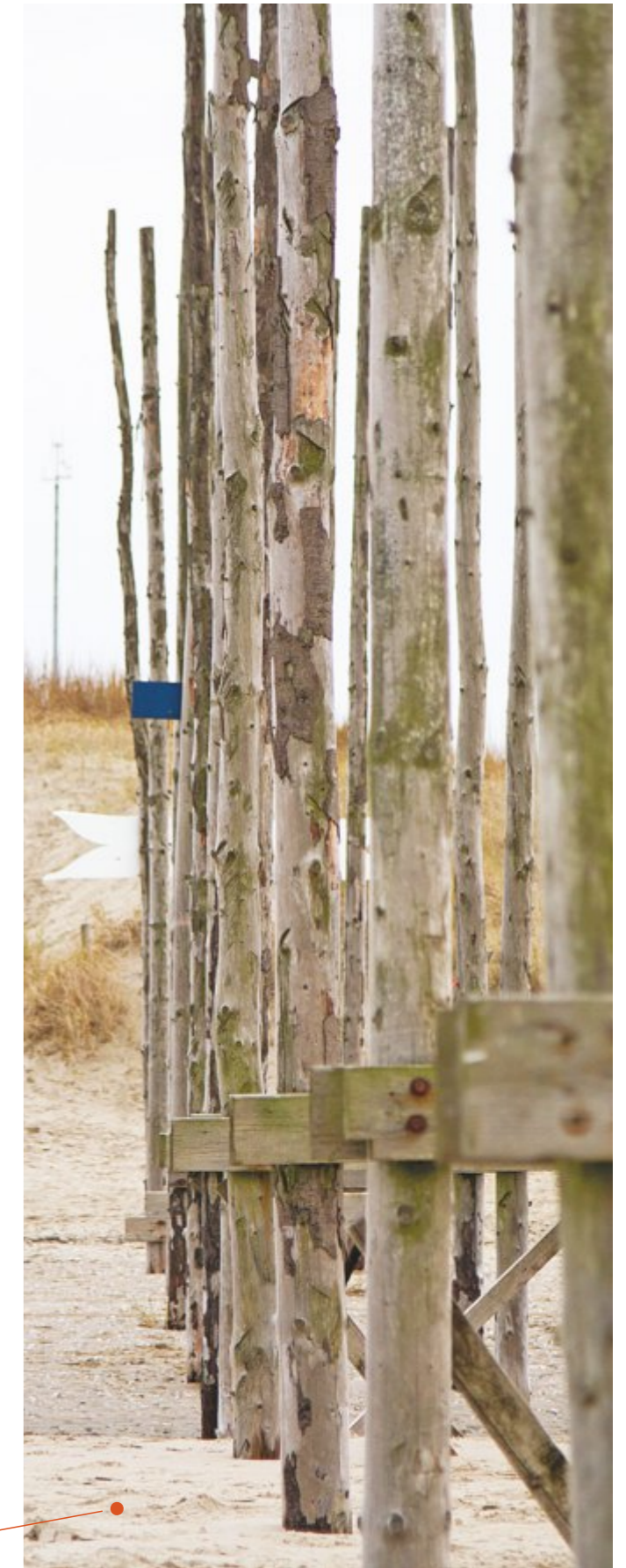
Steiger Waddenveer Paal 33