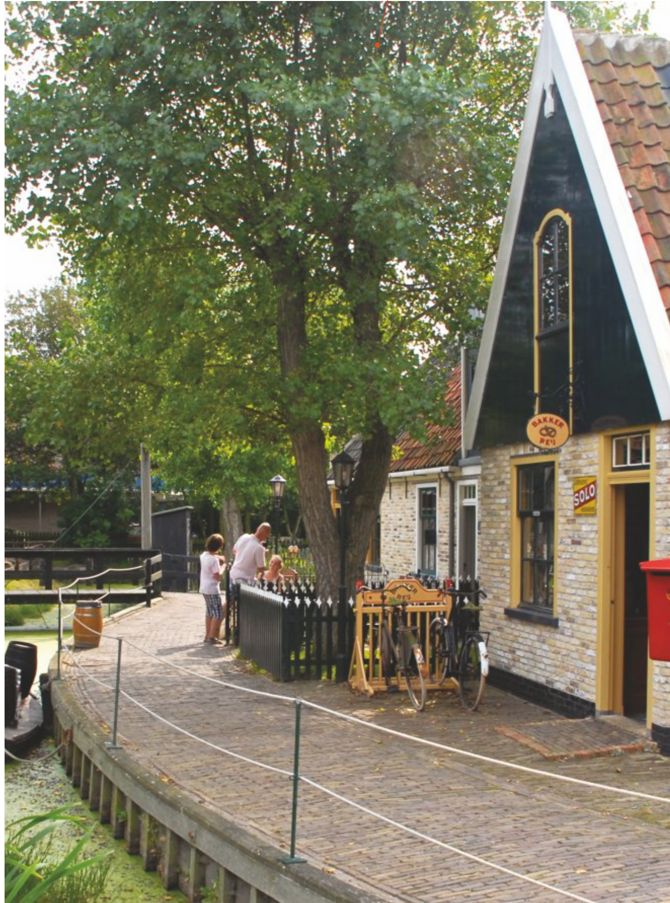
Museum Kaap Skil