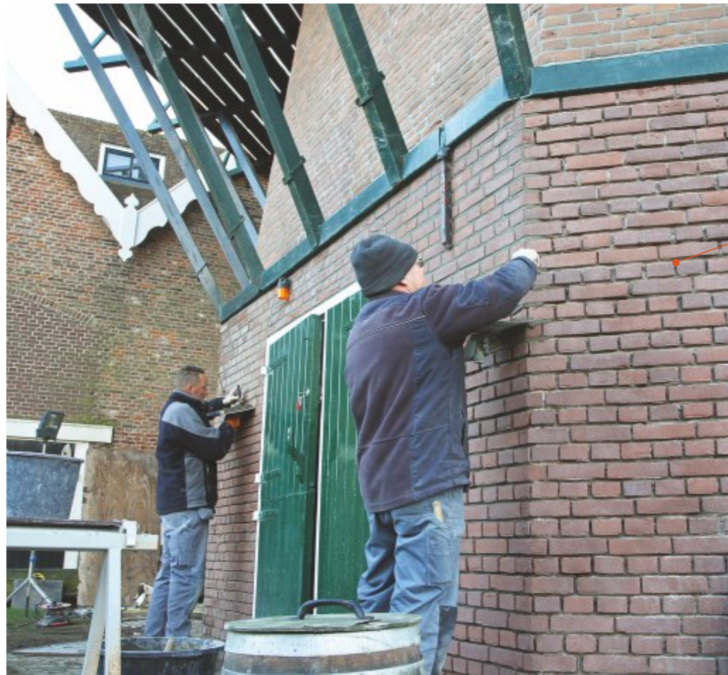
Renovatie molen De Traanroeier