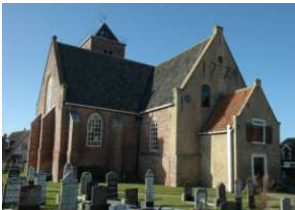
Aan de sarcofaag in de Maartenskerk te Oosterend droeg het Texelfonds € 942,- bij.

Lokale gemeenschapsfondsen die actief zijn binnen één gemeente, bieden hiervoor goede mogelijkheden. Het bijzondere aan deze fondsen is dat het burgers en bedrijven de gelegenheid biedt om geld te geven aan lokale goede doelen in de breedste zin van het woord en zo ruimte creëert voor een nieuwe vorm van particulier initiatief voor het publieke nut. Het lokale gemeenschapsfonds biedt een nieuwe structuur voor het inzamelen van geld voor plaatselijke goede doelen.