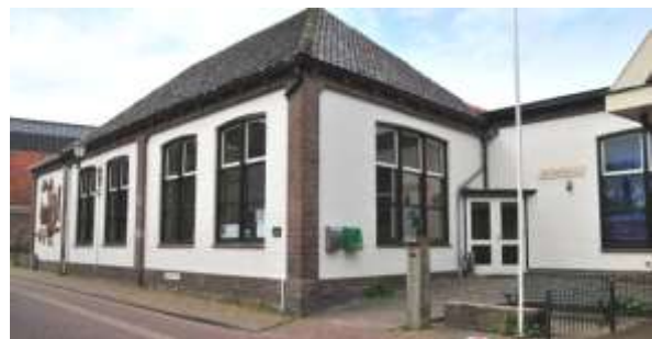
Aan Dorpshuis De Waldhoorn te Den Hoorn droeg het Texelfonds € 2.841,- bij.

Het Texelfonds werkt in de openbaarheid. Dat betekent dat het Texelfonds verantwoording aflegt over de manier waarop het geld in de lokale samenleving wordt besteed. Het aantal projecten waaraan het Texelfonds een bijdrage levert, hangt af van de gelden die aan het fonds worden toevertrouwd.