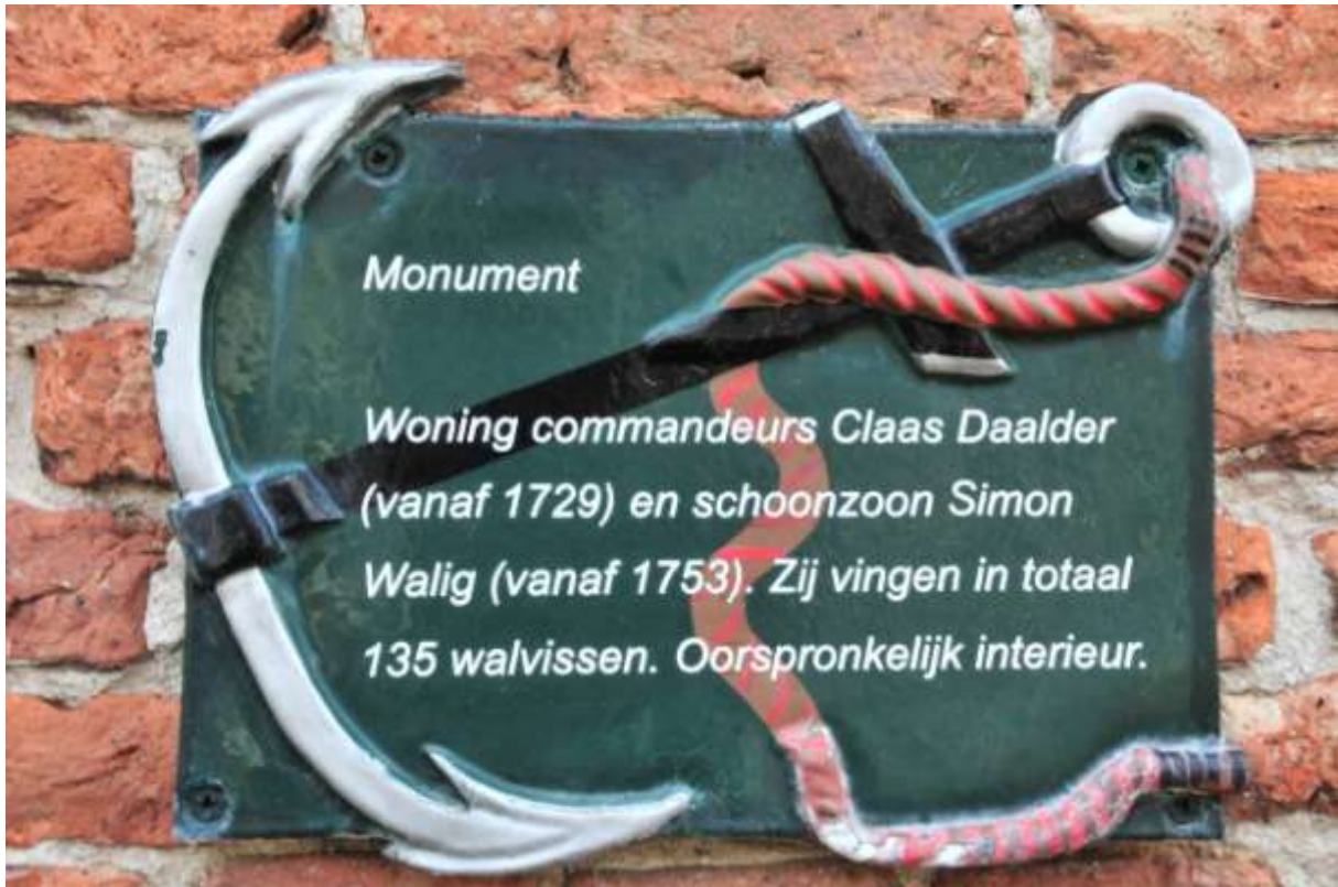
Aan de openstelling van het Walvisvaardershuisje in Den Hoorn droeg het Texelfonds € 2.000,- bij.