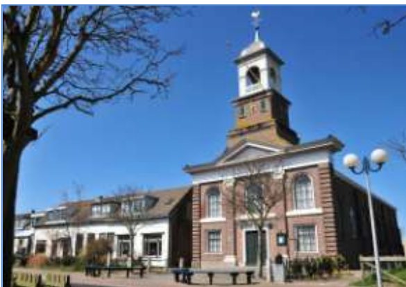
Aan de Waddenkerk te De Cocksdorp droeg het Texelfonds € 7.500,- bij.